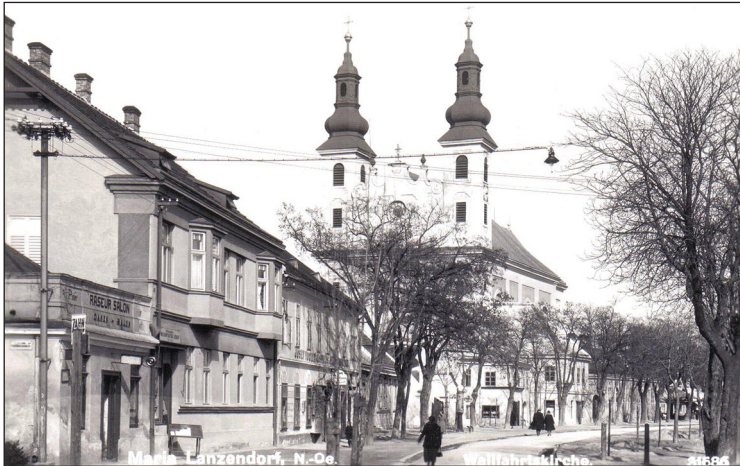
Die Wallfahrtskirche von Maria Lanzendorf. Aufnahme aus dem Jahre 1934

stand gegen ein übermächtiges Regime, andererseits aber auch für Denunziantentum, Obrigkeitshörigkeit und den Willen, den politisch anders Denkenden – auch wenn es der seit Jahren bekannte Nachbar war – existenziell zu zerstören. Zudem zeigen die betreffenden Volksgerichts- und Opferfürsorge-Akten sehr gut auf, wo die eigentliche Solidarität der Gesellschaft in der Nachkriegszeit lag.