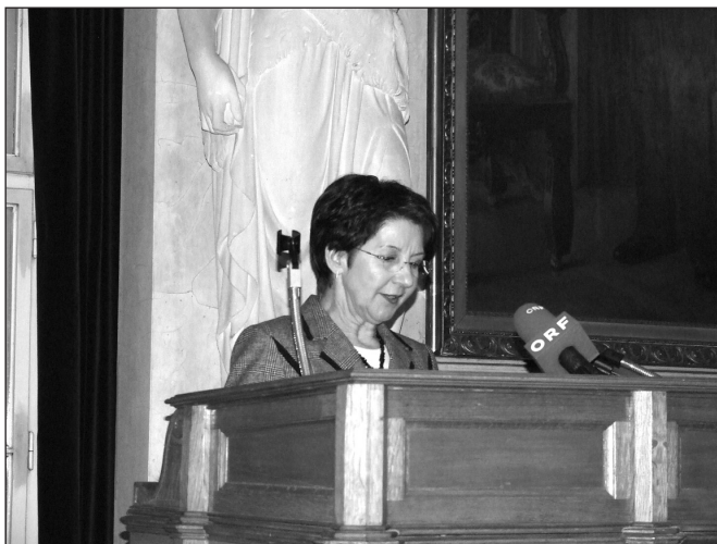
Oben: Nationalratspräsidentin Barbara Prammer bei ihrer Festrede